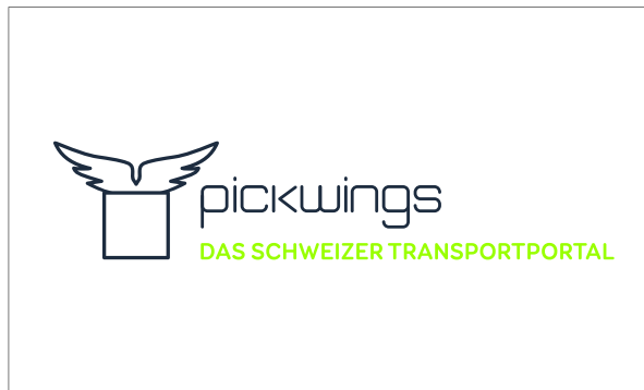
Standard Version - weisser Hintergrund