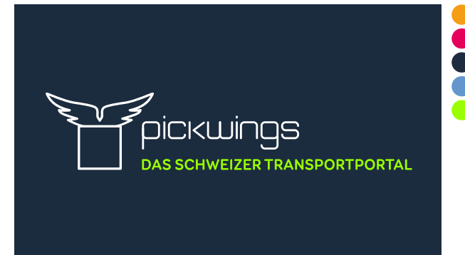
Standard Version - Pickwings Farben Hintergrund