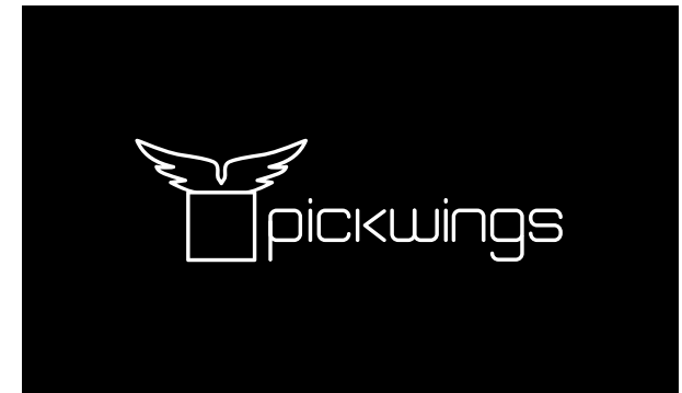
Schwarzweiss Version - schwarzer Hintergrund