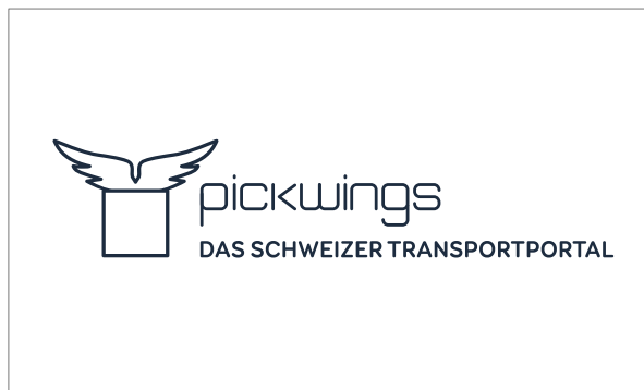
Schwarzweiss Version - weisser Hintergrund