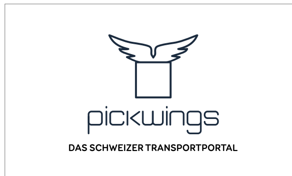
Schwarzweiss Version - weisser Hintergrund