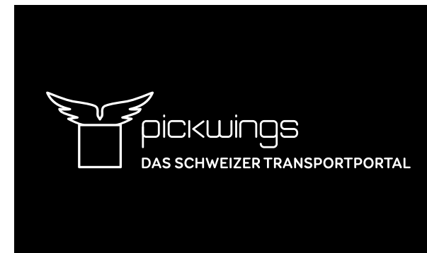
Schwarzweiss Version - schwarzer Hintergrund