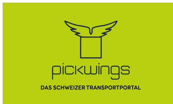
Farbversion - heller Hintergrund