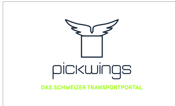
Standard Version - weisser Hintergrund