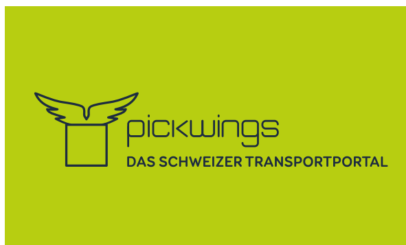
Farbversion - heller Hintergrund