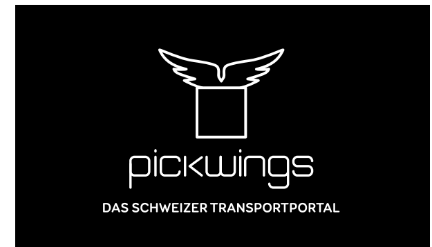
Schwarzweiss Version - schwarzer Hintergrund