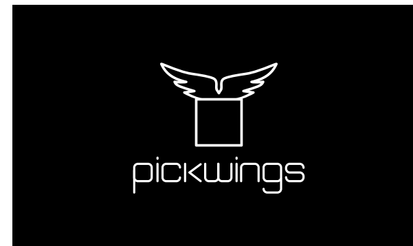
Schwarzweiss Version - schwarzer Hintergrund