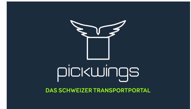
Standard Version - Pickwings Farben Hintergrund